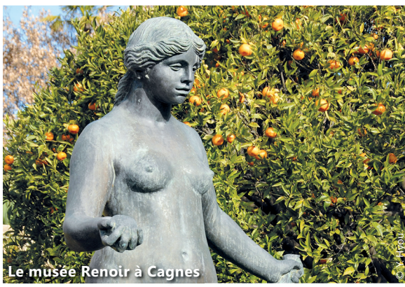
Le musée Renoir à Cagnes

Le musée Matisse et le musée Chagall à Nice, la fondation Maeght à Saint-Paul-de-Vence, la chapelle Notre-Dame-du-Rosaire à Vence, la maison de Renoir à Cagnes, le musée Picasso d'Antibes, le Musée national Fernand-Léger à Biot, la chapelle Saint-Pierre-des-Pêcheurs à Villefranche-sur-Mer décorée par Cocteau, les villas Ephrussi de Rothschild et Kérylos à Saint-Jean-Cap-Ferrat